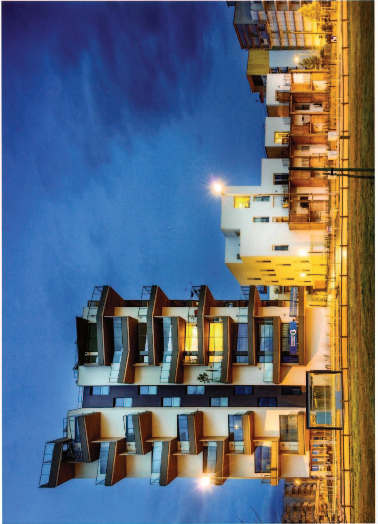
ILOT JULES VERNE – Maîtrise d'ouvrage : Bouygues Immobilier / Agence Brochet Lojus Pueyo / 145 logements livrés