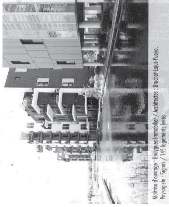
Maîtrise d'ouvrage : Bouygues Immobilier / Architectes : Brochet-Lajus-Pueyo. Paysagiste : Signes / 145 logements livrés

Bouygues Immobilier. Ils coordonnent la réalisation du projet urbain et réalisent les espaces publics avec Signes Ouest, ainsi qu'une partie du programme de construction. La diversité des formes et des ambiances, résolument contemporaine, est recherchée par l'intermédiaire d'une architecture bioclimatique intégrée au site. Il s'agit notamment de dégager des vues et des ouvertures sur le paysage exceptionnel du lac. La généralisation des îlots ouverts a permis la création d'une véritable variété, tant dans les volumes bâtis, les hauteurs, que dans les différentes écritures architecturales. Les espaces de respiration au sein du quartier constituaient un véritable enjeu lors de sa conception, que ce soit par le biais d'espaces verts publics, de jardins suspendus ou encore de jardins privatifs.