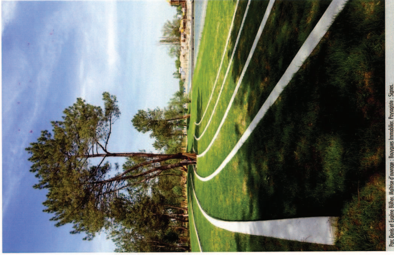
Parc Denis et Eugène Bülher. Maîtrise d'ouvrage : Bourgues Immobilier. Paysagiste : Signes.

La conception durable du parc passe également par l'ambiance qui y règne et son rôle socialisateur. L'objectif : en faire un lieu emblématique du quartier, point de rencontre entre les habitants de Ginko et ceux des Aubiers. Le parc a été ouvert en septembre 2013.