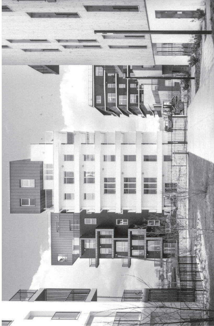
ILOT SAINT EXUPÉRY — Maîtrise d'ouvrage : Bouygues Immobilier / Agences Rousselle & Laïsrié et Poggi & Garrigue / 156 logements livrés