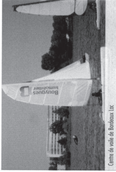
Centre de voile de Bordeaux Lac

Les enfants des écoles voisines Jean Monnet et Lac 2 ont participé à la plantation de fougères et arbustes durant l'hiver 2011 et le printemps 2012. Leur nom figure sur les étiquettes des arbustes qu'ils ont plantés. Ils ont également installé des nichoirs dans les arbres. Ceux de l'école Vaclav Havel ont quant à eux planté des arbustes à leur nom dans la venelle. Ces actions sont l'occasion de créer du lien avec le quartier voisin des Aubiers dès le plus jeune âge et de s'approprier le nouveau parc partagé entre les deux quartiers. Des ateliers de sensibilisation sur l'énergie ont également été organisés avec Cafely Services.