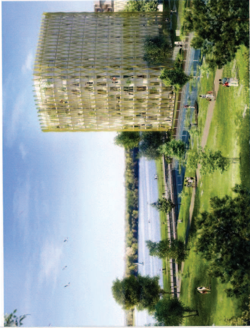
ORION — Maîtrise d'ouvrage : Bouygues Immobilier / Agence Tétrac / 62 logements / livraison : décembre 2014