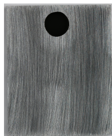
FIGURE 2 – Pièce en acier de nuance 42CrMo4 avant nitruration.

Les échantillons sont en acier de nuance 42CrMo4. La composition est donnée dans le Tableau 2. Ils sont de forme parallélépipédique de 17 \times 13 \times 5 \text{ mm}^3 .